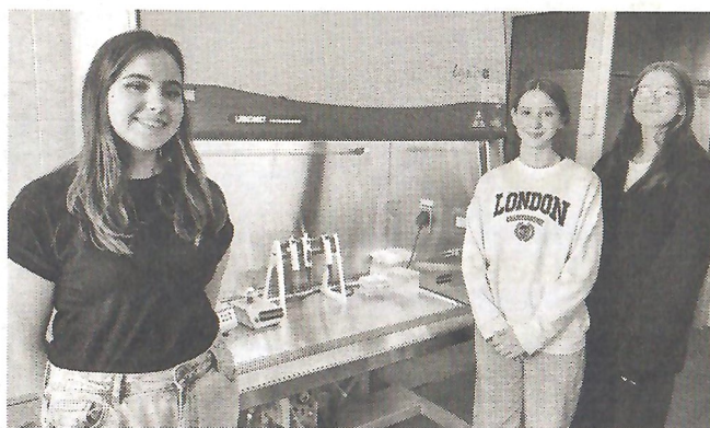
Знакомство с профессией, посещение лаборатории ЦМСЧ № 31 участниками платформы «ЭкоСтарт» от школы № 54 и ЦВР

Юные исследователи изучали и анализировали данные, выполняли проектные работы. А затем состоялось итоговое мероприятие платформы «ЭкоСтарт» для развития проектно-технологического