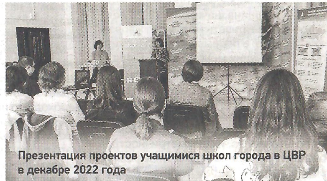
Презентация проектов учащимися школ города в ЦВР в декабре 2022 года

Проект «Парковая зона в окрестностях Верх-Нейвинского пруда», обследование территории будущего парка учениками гимназии № 41