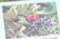
Арктоус альпийский Arctostaphylos