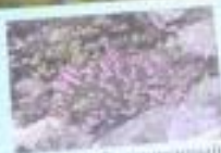
Вереск обыкновенный Calluna vulgaris