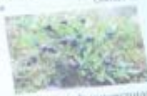
Черника обыкновенная Vaccinium myrtillus