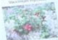
Брусника обыкновенная Vaccinium vitis-idaea