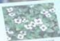
Деренник тундровый Galium tundrae